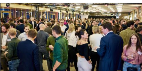
11 ème édition de la Garden Party SPORSORA, Hippodrome ParisLongchamp, le 07/09/22

Depuis 19 ans, les Trophées SPORSORA du Marketing Sportif récompensent les stratégies les plus complètes, transversales et innovantes menées par les acteurs de l'économie du sport de l'année écoulée. En valorisant les bonnes pratiques des acteurs du secteur à l'occasion d'une cérémonie sur-mesure dans des lieux d'exception, suivie d'un des plus gros cocktails de networking de l'année, les Trophées SPORSORA se sont imposés au fil des éditions comme étant LA référence sur le marché.