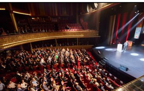
18 ème édition des Trophées SPORSORA du Marketing Sportif aux Folies Bergère, le 16/04/22