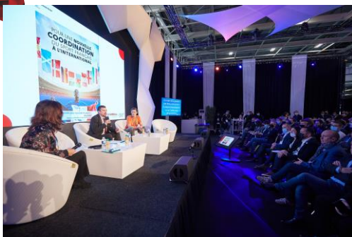
2ème Observatoire des GESI, le 25/11/2021