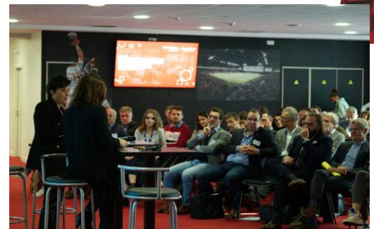
Observatoire du Naming, le 21/10/2021