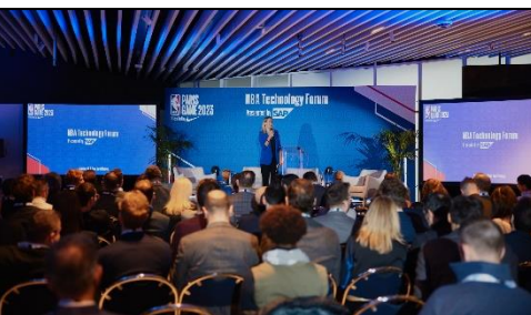
NBA Technology Forum Presented by SAP, le 19/01/2023