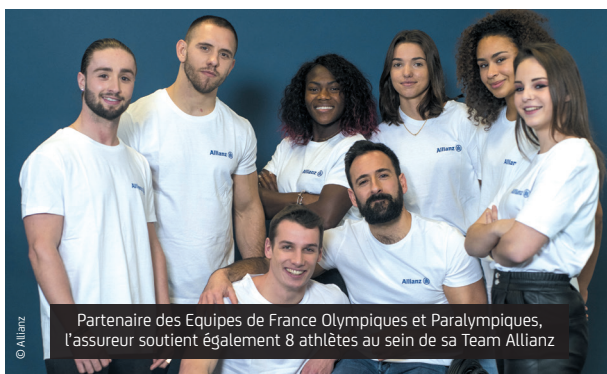
Partenaire des Equipes de France Olympiques et Paralympiques, l'assureur soutient également 8 athlètes au sein de sa Team Allianz

Olympiques et Paralympiques pour la période 2021-2028 et propose ses solutions d'assurances aux Comités d'Organisation, aux Comités Nationaux Olympiques du monde entier, ainsi qu'aux autres partenaires privés. L'idée est de couvrir l'ensemble de l'écosystème du sport en partant du mouvement olympique pour rayonner vers les fédérations, les organisateurs d'événements, les ligues, les clubs, les athlètes et les pratiquants. Pour répondre efficacement aux besoins des acteurs du sport, il est stratégique d'intégrer leur écosystème. Cela permet d'identifier les évolutions en matière d'organisation ou de pratique du sport, pour pouvoir adapter la prévention des risques.