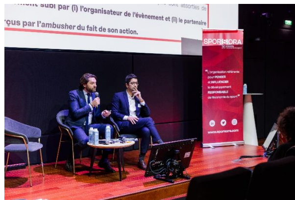
Intervention du cabinet d'avocats De Gaulle Fleurance et Associés sur l'ambush marketing