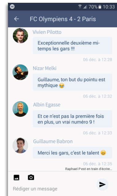
Messagerie entre joueurs et Entraîneurs (appli)