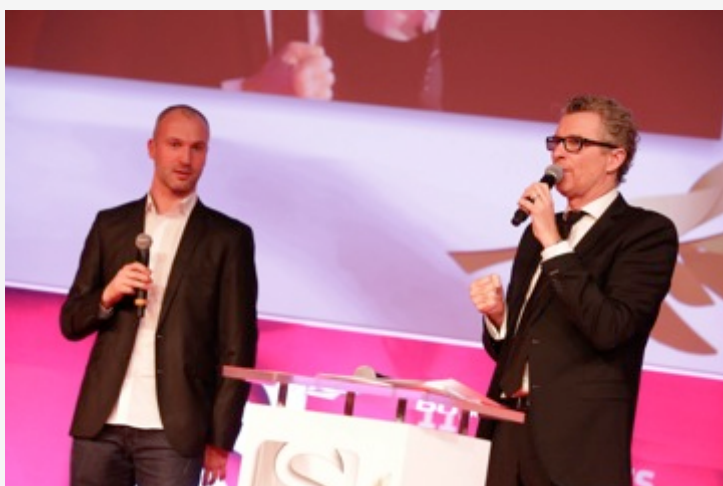
Denis Brogniart, animera la 12 e édition

Laissez-vous embarquer, le temps d'une soirée d'exception, pour un voyage au fil du lien indéfectible entre le Sport et le vaste domaine de la Communication. Une belle histoire qui a traversé les temps, pour vivre pleinement aujourd'hui et déjà se tourner vers demain.